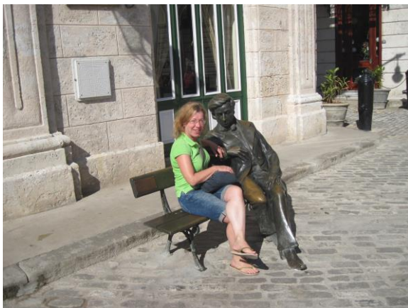
...por ejemplo, Chopin...